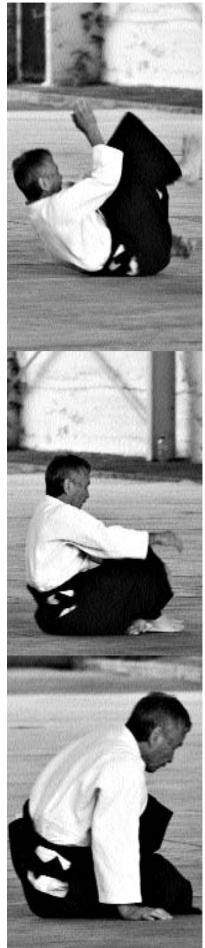
Maître Tamura – La colle s/Loup.

Donc notre pratique doit être intelligente, de manière à protéger notre corps. Toute action dure doit être prohibée. L'action souple, le non-agir, sont préférables. J'ai écrit un article intitulé « Agir sans agir » qui a été publié dans Sesaragi en février 2007. L'action de notre pratique c'est d'amener l'autre dans une situation où il ne peut pas faire autrement que de tomber. C'est le guider vers sa chute, et non le faire chuter. Cela demande beaucoup plus de travail que de prendre quelqu'un et de le projeter. Un gorille en kimono, ou même sans kimono, il prend quelqu'un et le jette. Il ne fait pas d'aïkido. C'est une bestiole qui